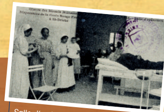
Salle d'opération du dispensaire de la Croix-Rouge à Saint-Brieuc durant la Première Guerre mondiale

Au cours de la Grande Guerre, la Bretagne, éloignée de la ligne de front, accueille les réfugiés belges et français des territoires occupés, mais aussi les blessés français et étrangers. Soignés dans des hôpitaux temporaires, plantés dans l'ensemble du Grand Ouest, certains vont succomber à leurs blessures ou de maladies.