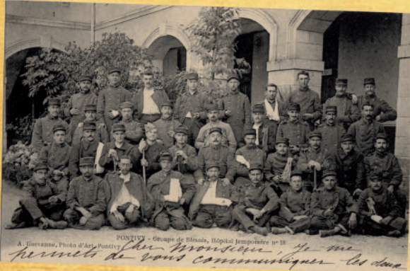
Pontivy, groupe de blessés l'hôpital temporaire n° 18

Il est emprisonné à la suite d'une dénonciation. Pedro Flores-Cano, né le 2 février 1917 à Carolina en Espagne, capitaine FFI, était responsable des groupes armés espagnols pour la région Bretagne. Il a été fusillé au Colombier à Rennes, le 8 juin 1944 avec huit autres camarades républicains espagnols engagés dans la Résistance.