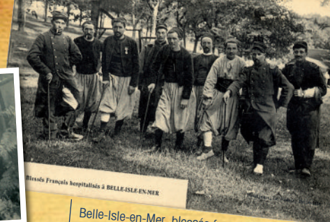
Belle-Isle-en-Mer, blessés français hospitalisés durant la Première Guerre mondiale