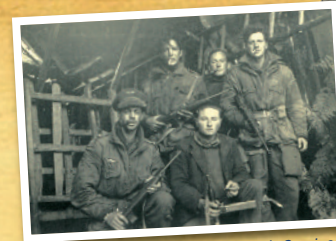
Trois hommes du Special Air Service (SAS), parachutistes de la France Libre, reconnaissables à leur tenue. Ils sont accompagnés de deux résistants.

Aujourd'hui, au fond de la nécropole, a été érigé un monument-ossuaire. Surmonté d'une statue d'un mobile breton, ce monument renferme, sans distinction, une vingtaine de corps de soldats de l'Armée de la Loire, rappelant ainsi le sacrifice de ces hommes dont beaucoup étaient originaires de Bretagne