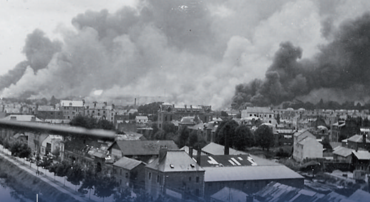
Le bombardement de la plaine de Baud, vu d'un balcon le 17 juin 1940.

Située sur la commune de Sainte-Anne d'Auray, la nécropole nationale, créée en 1959, regroupe les dépouilles de soldats morts pour la France, lors des combats de la Loire en 1870-1871, des deux guerres mondiales et de la guerre d'Indochine. Ce cimetière rassemble également les dépouilles des soldats décédés dans les anciennes structures sanitaires qui ont été créées en 1914-1918 et 1939-1945 mais aussi les corps de ceux inhumés dans les cimetières militaires communaux de Bretagne, du Poitou et des Pays de la Loire. Depuis 1983-1984, ce site rassemble les restes mortels de combattants français inhumés initialement dans des carrés militaires communaux de Normandie, ainsi que les corps de soldats belges décédés en 1914-1918 exhumés en Bretagne. En 1988, les sépultures de militaires belges décédés en 1914-1918 en Haute-Garonne et dans les Hautes-Pyrénées y sont transférées.