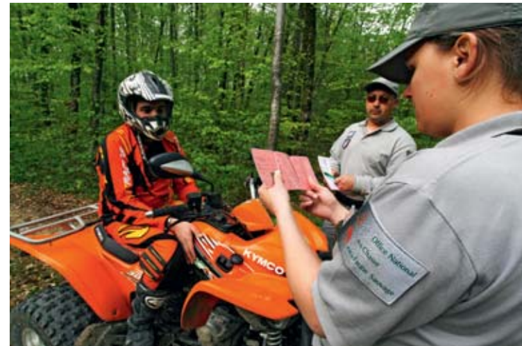
▲ La circulation dans les espaces naturels avec des véhicules à moteur est strictement réglementée. Les quads, 4x4 et autres engins motorisés causent en effet des dommages aux milieux naturels, à la faune et à la flore

Extrait du rapport 2012 des polices de l'eau et de la nature, Bureau des polices de l'eau et de la nature de la Direction de l'eau et de la biodiversité.