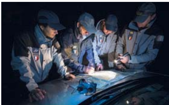
◀ Chaque intervention suppose une parfaite connaissance du terrain

Publié par le Service départemental du Calvados, n° 104 – octobre-décembre 2013