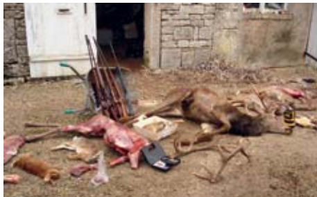
◀ Résultat d'une saisie réalisée par les inspecteurs de l'environnement