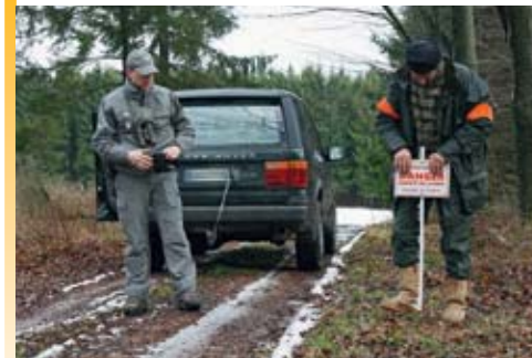
◀ Les agents de l'environnement contrôlent la signalisation des zones de chasse près des routes