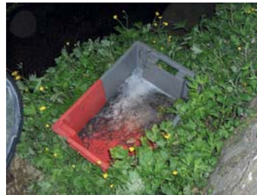
◀ La civelle est une espèce particulièrement prisée par les braconniers