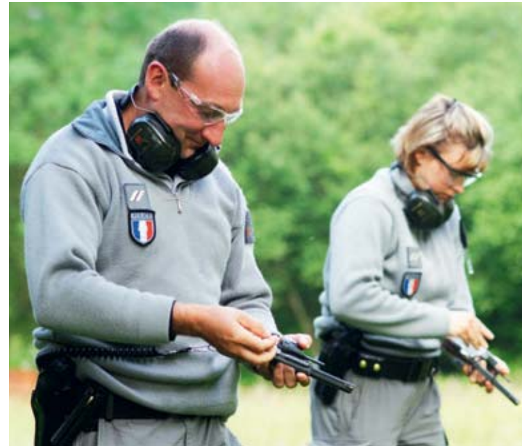
▲ Inspecteurs de l'environnement lors d'un entraînement au tir

Ces missions contribuent également à rendre effectives les grandes orientations politiques arrêtées par le ministère chargé de l'Environnement, notamment la Stratégie nationale de sauvegarde de la biodiversité (SNSB).